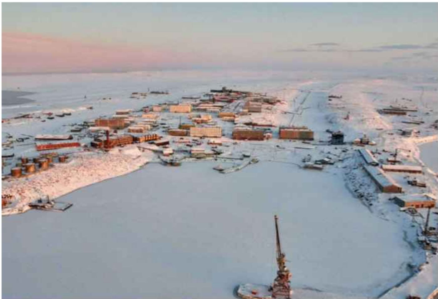
Фотография материковой части пгт. Диксон