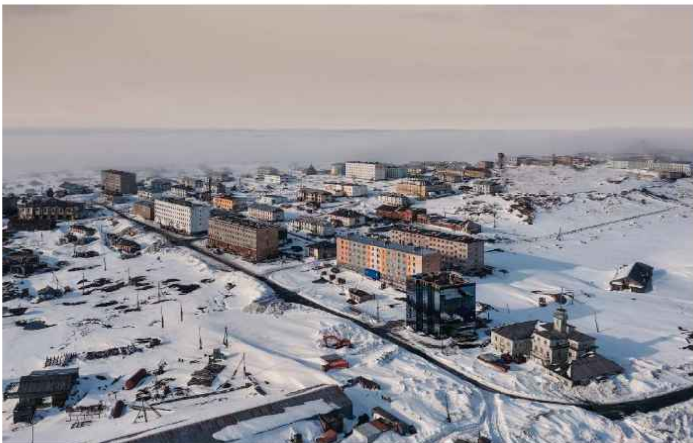
Фотография материковой части пгт. Диксон