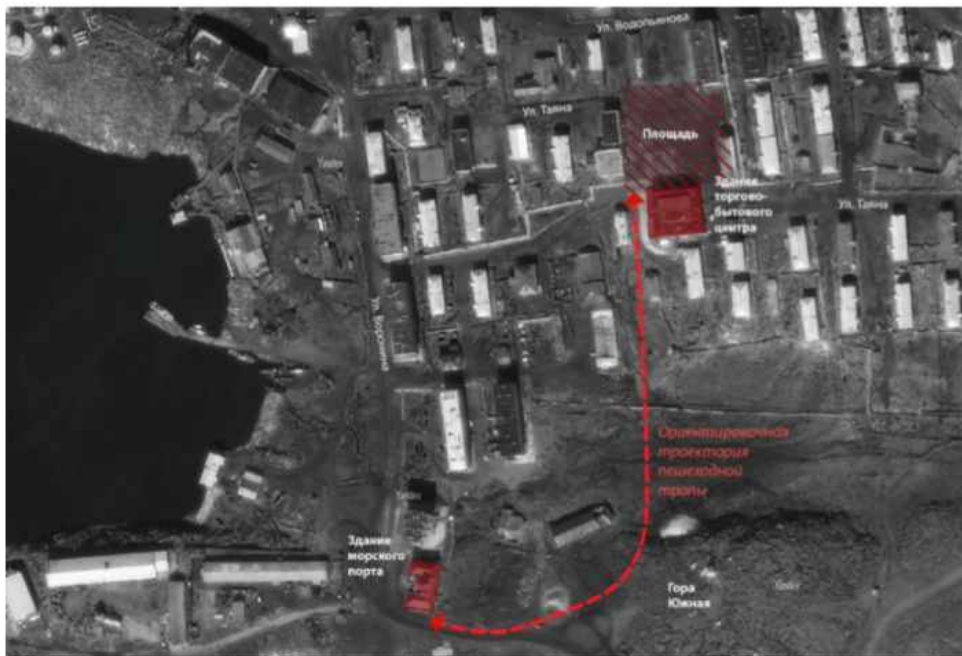
Схема №2. Ориентировочная траектория пешеходной тропы