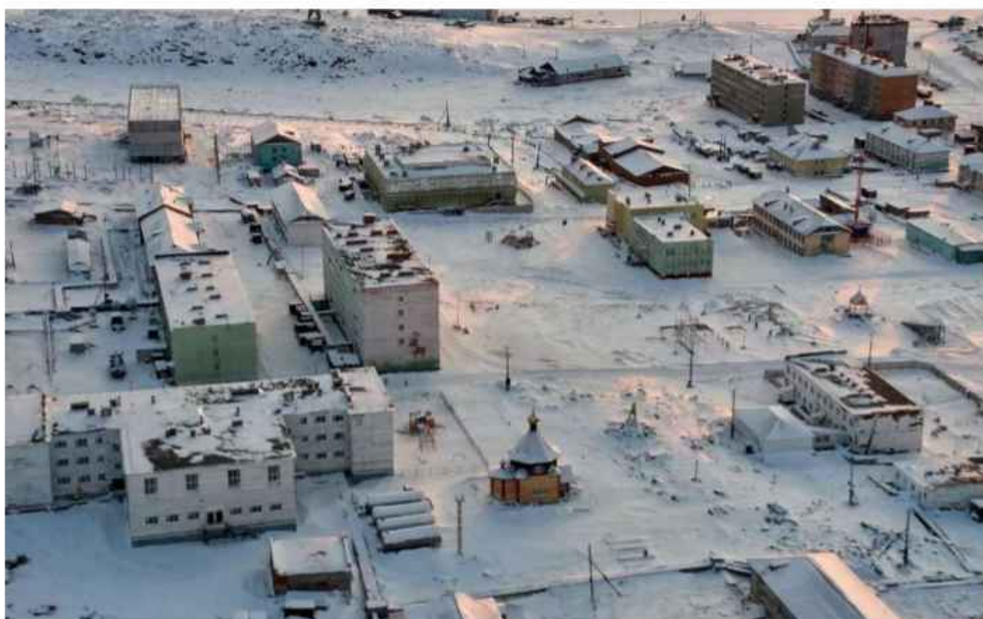
Фотография площади перед зданием торгово-бытового центра