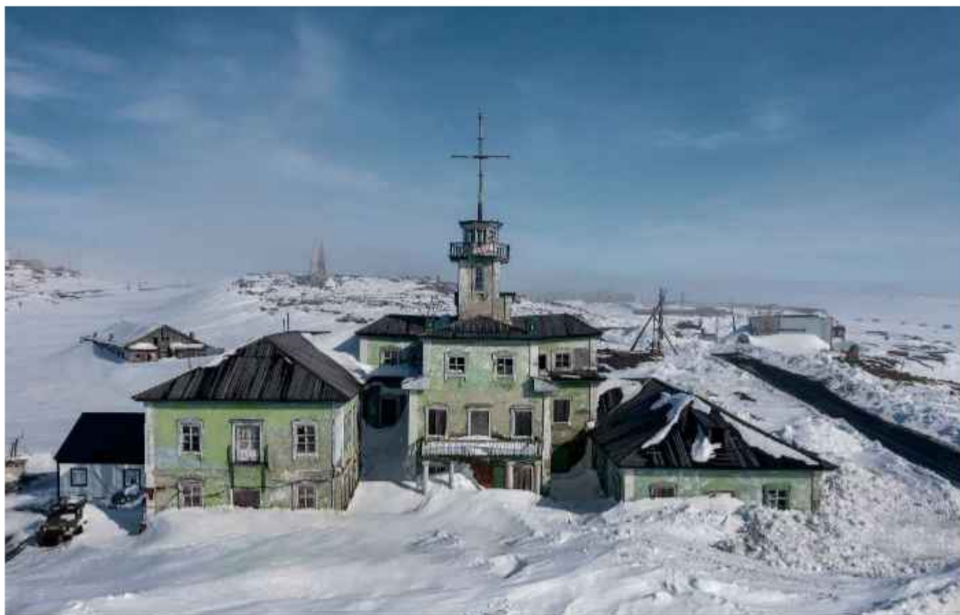
Фотография здания морского порта