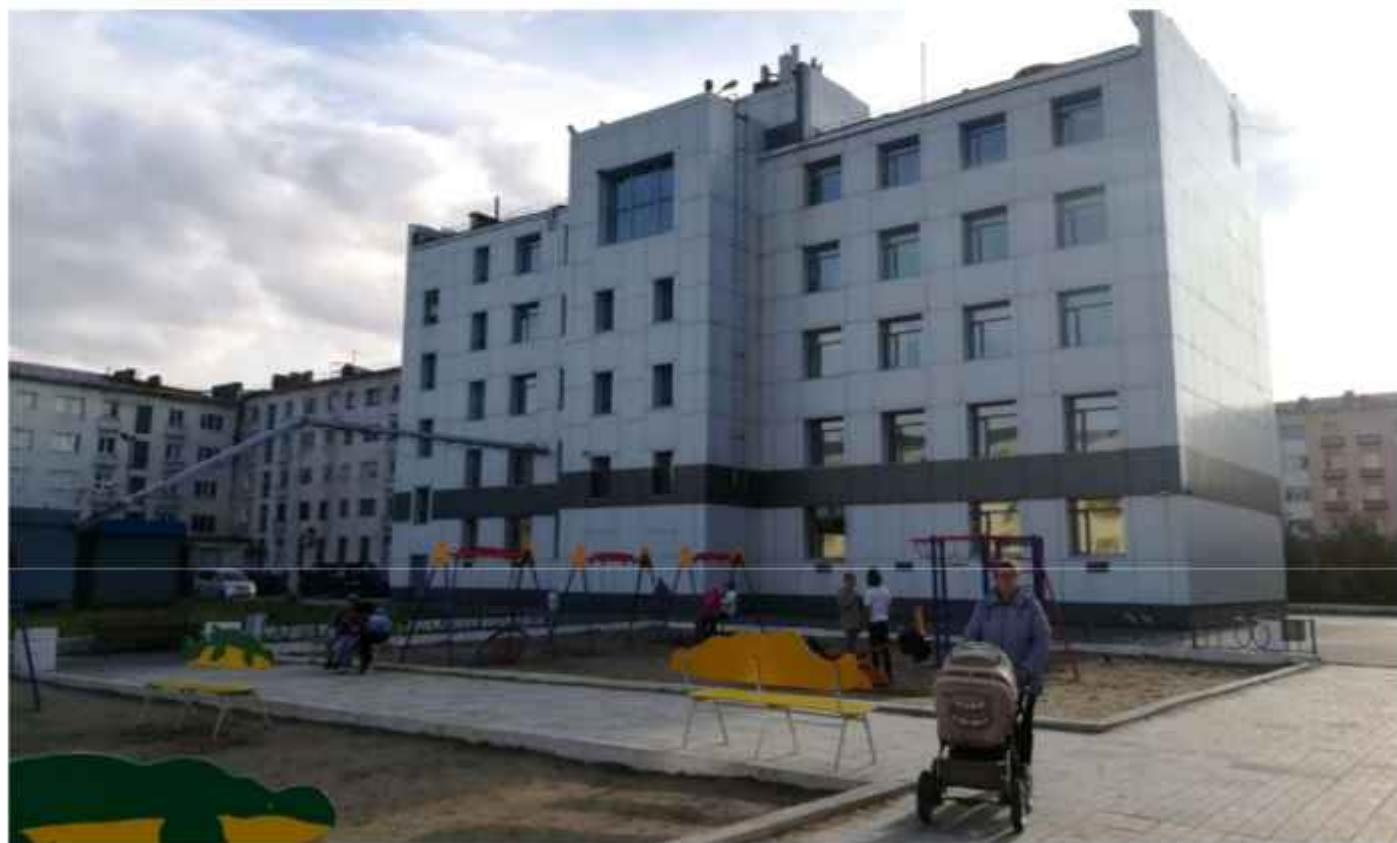
Фотофиксация текущего состояния общественной территории