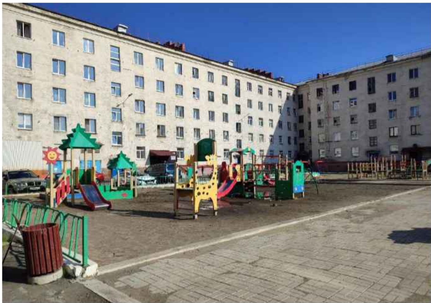
Фотофиксация текущего состояния общественной территории