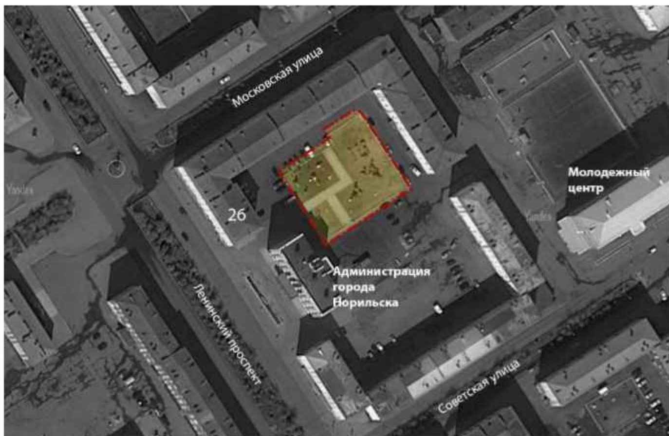
Схема №2. Границы территории