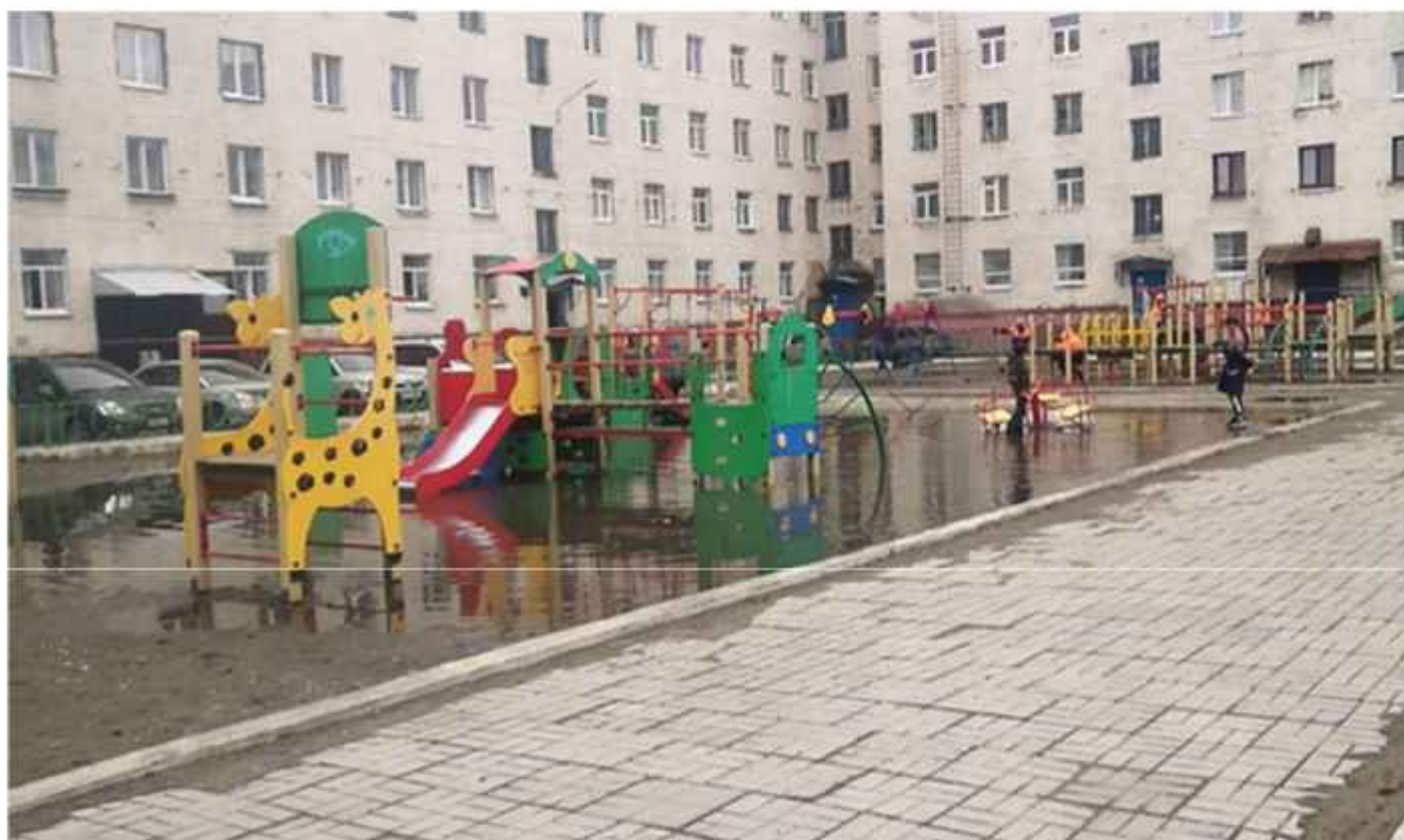
Фотофиксация текущего состояния общественной территории